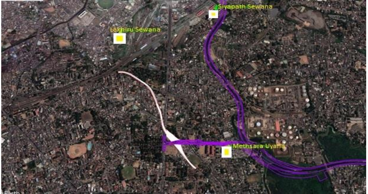
உருவம் 3: தற்போதைய குடியிருப்புக்களின் அமைவிடங்கள் மற்றும் வேறிடப்படுத்துவதற்கான உத்தேச தளங்கள் என்பனவற்றிற்கிடையிலான ஒப்பீடு

பிரிவு 02 இல் வசிக்கும் கருத்திட்டத்தினால் பாதிக்கப்பட்டுள்ள வீட்டுடமைகளுக்காக ஒதுக்கப்பட்ட மூன்று வீட்டுத் திட்டங்களுக்கான தூரம் 0.5 இற்கும் 2 கி.மீ. இற்கும் இடைப்பட்ட தூரமாகும். மேலேயுள்ள வரைபடம் கருத்திட்டப் பகுதியையும் (வெள்ளை நிறத்தில்) மூன்று வீட்டமைப்புத் திட்டங்களின் அமைவிடங்களையும் (மஞ்சள் நிறத்தில்) காட்டுகிறது. உத்தேச உயர்த்தப்பட்ட நெடுஞ்சாலையினை ஊதா நிறம் பிரதிபலிக்கின்றது.